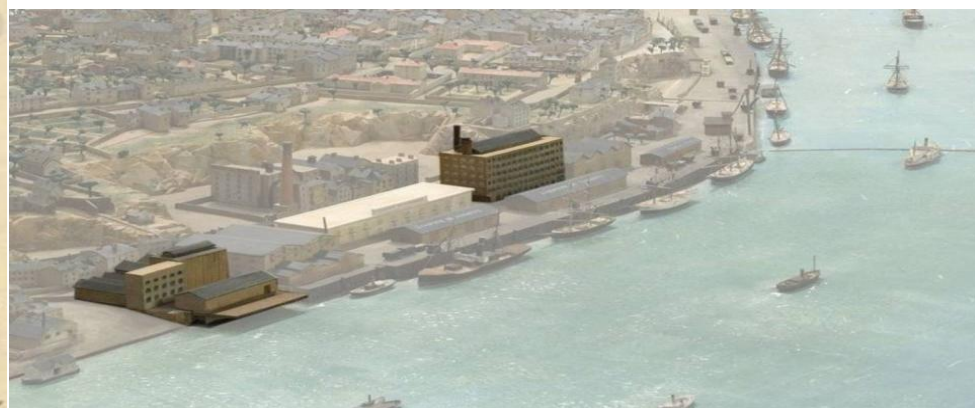
Quai Saint Louis à Nantes emplacement des moulins