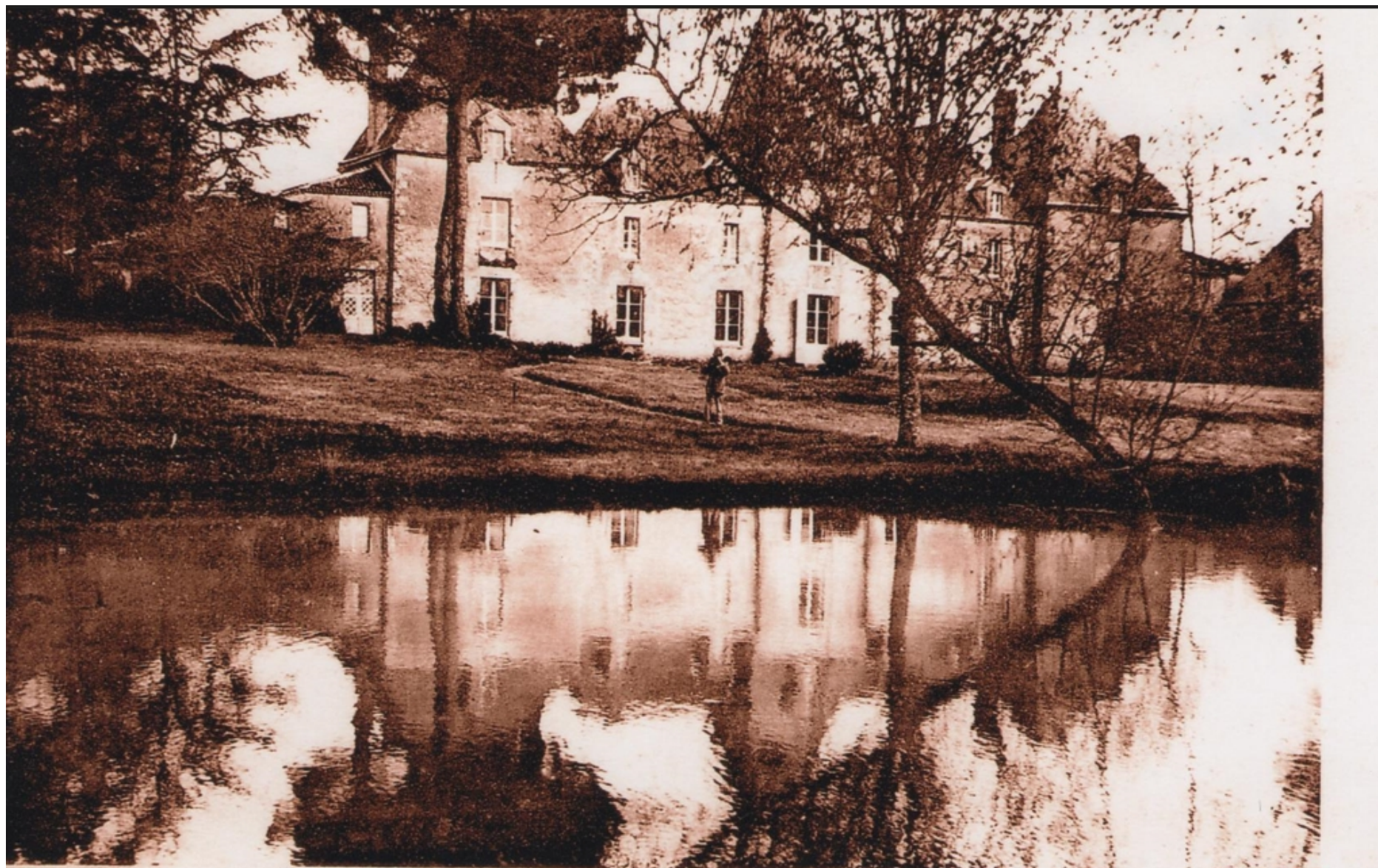
Château du Soullières - CERIZAY (D.-Sèvres)