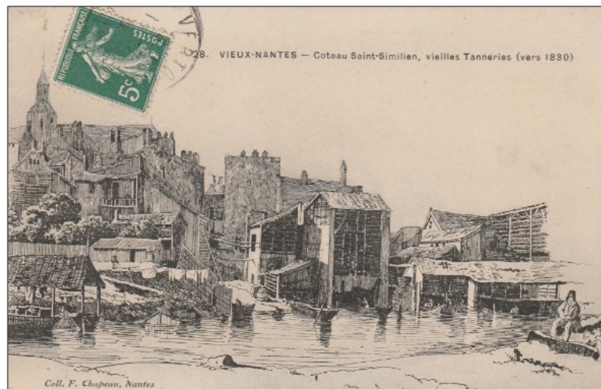
La Cour LEROUX et Les tanneries de Nantes vers 1830